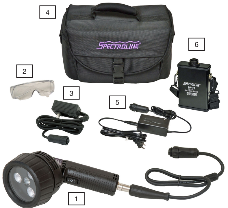
1 TRITAN 365 TRI-365MHB TRI-365MDB TRI-365MDBB